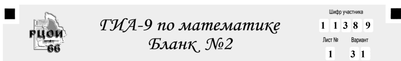
Рис. 17. Заполнение регистрационной части бланка №2 по русскому языку и по математике.

В Бланке №2 по математике ниже регистрационной части расположена область записи ответов на задания В3 – В8, ответы на которые содержат сложные математические выражения, содержащие дроби, корни, степени и т.д. Ответ на задание вписывается аккуратно справа от номера задания внутри белого поля (рис. 18). Оценивание ответов на эти задания будет проводиться экспертами.